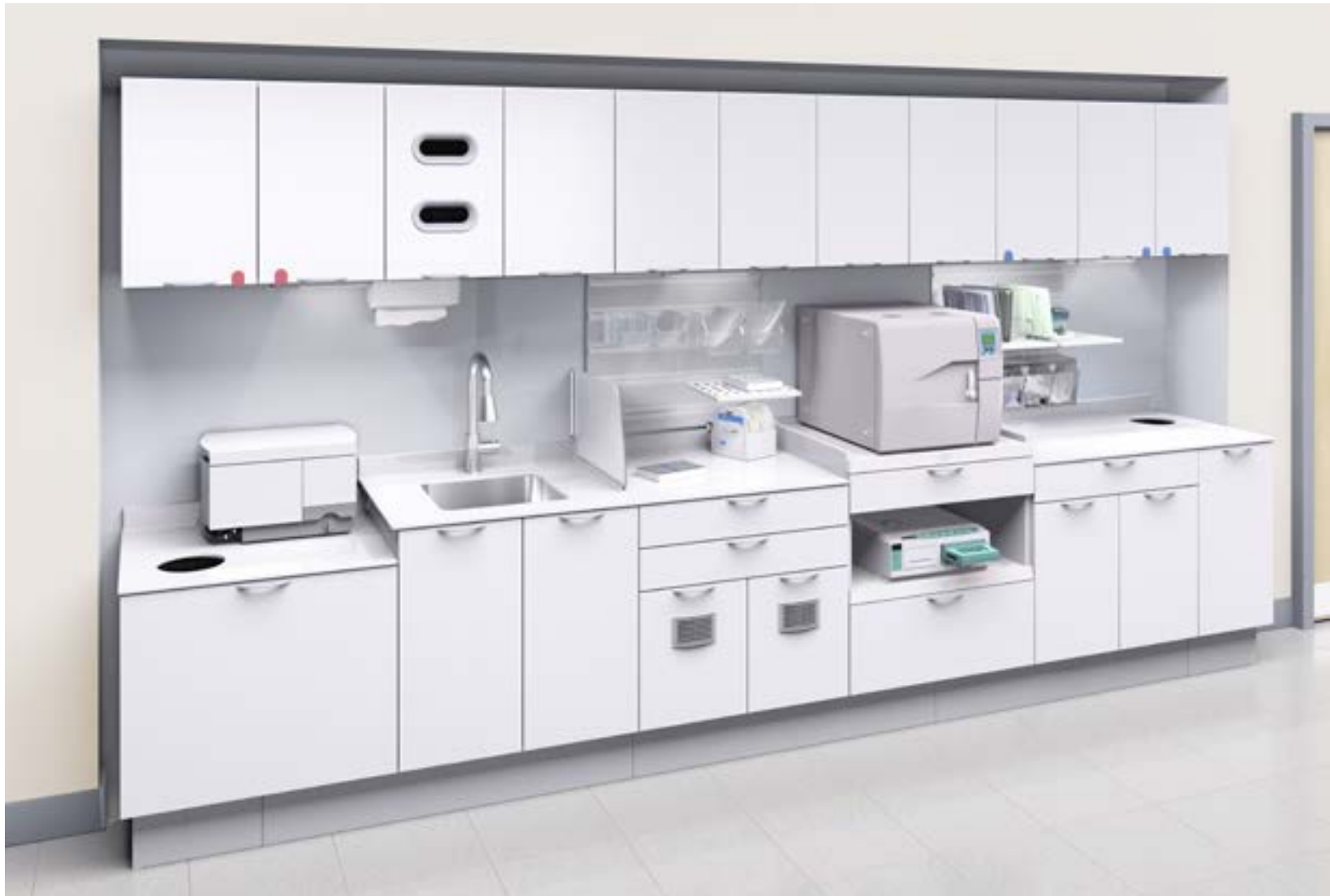
Un centre de stérilisation efficace et systématique contribue au maintien d'un cabinet sûr et permet de gagner un temps précieux.